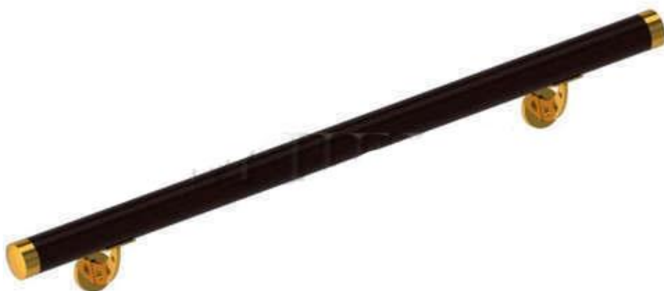
Конструкция №10: Круглый поручень: от 3200 руб. м/п Заглушки и пристенные крепления входят в стоимость