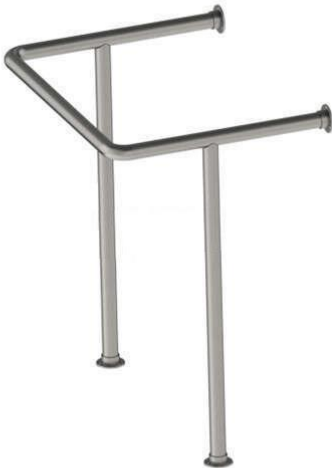
Поручень вокруг раковины: 5900 руб.