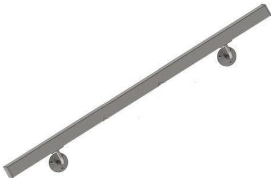
Конструкция №9: Квадратный поручень от 2300 руб. м/п Заглушки и пристенные крепления входят в стоимость